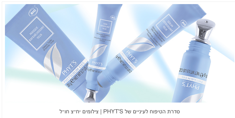
סדרת הטיפוח לעיניים של PHYT'S | צילומים יח"צ חוייל

מוצרי המותג אשר נמכרים בעולם אצל קוסמטיקאיות ומכוני ספא בלבד, ישווקו בישראל ברשתות הפארם, והסדרות הראשונות שתזכנו לראות אצלנו על המדפים: סדרת האנטי-אייג'ינג, סדרת טיפוח לעיניים, סדרה על בסיס חומצה היאלורונית, סדרה להבהרת העור, סדרה לגבר בשילוב אנטי-אייג'ינג, סדרת לאיזון עור שמן, סדרת טיפוח בחמצן לעור, סדרת ניקוי פנים בסיסית ומגוון רחב של מוצרי איפור טבעי ואורגני של המותג.