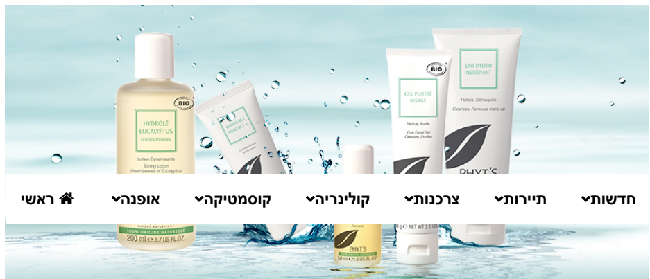
( http://www.kib.co.il/wp-content/uploads/2016/12/PHYTS-1.jpg )

כרקע – עד היום הדרישות של משרד הבריאות בנושא מוצרי קוסמטיקה טבעית ואורגנית עמדו על פי הדרישות של תו התקן "ECOCERT" – כלומר, מינימום 95 אחוזים של מרכיבים טבעיים או ממקור צמחי, מינימום 50 אחוזים של מרכיבים צמחיים מחקלאות אורגנית ומינימום ש-5 אחוזים מסך כל המרכיבים מחקלאות אורגנית. ועתה – הבשורה החדשנית שאושרה בימים אלו על ידי משרד הבריאות היא קבלת היכר של תו התקן החדש ה- "COSMEBIO", התקן המחמיר יותר כתקן לקוסמטיקה טבעית ואורגנית, שדרישותיו הן מינימום 95 אחוזים מרכיבים טבעיים או ממקור טבעי, מינימום 95 אחוזים של מרכיבים צמחיים מחקלאות אורגנית (לעומת 50 אחוז בתקן ECOCERT הקיים) ו- 10 אחוזים מסך כל המרכיבים שהיו מן החקלאות האורגנית (לעומת 5 אחוז בתקן הקיים).